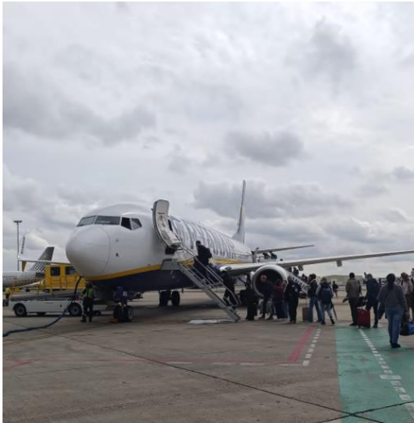
Viaje a Andalucía