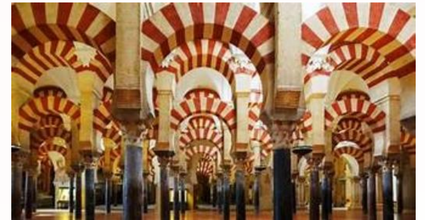
Mezquita-Catedral de Córdoba