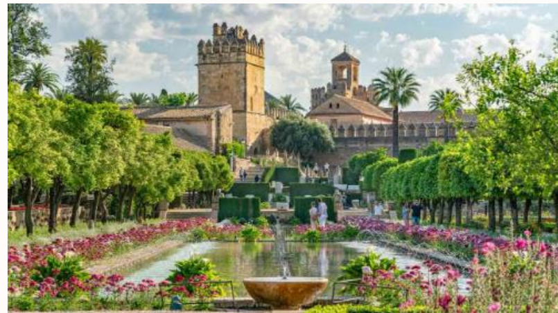
Alcázar de los Reyes Cristianos